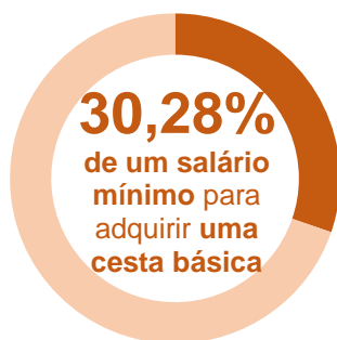
Gráfico 3 Participação do custo da Cesta Básica no salário mínimo (1) – Set. 2019

Em setembro de 2019, o tempo de trabalho gasto para se obter uma cesta básica em Salvador, por um trabalhador que recebe um salário mínimo por mês, foi de 66 horas e 36 minutos, ou seja, um comprometimento de 30,28% da sua renda. Nesta análise, considerou-se um salário mínimo líquido no valor de R$ 918,16 1 , descontando-se 8,00% de contribuição previdenciária do salário bruto de R$ 998,00.