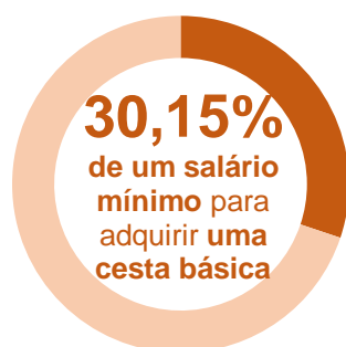
Gráfico 3 Participação do custo da Cesta Básica no salário mínimo (1) – Out. 2019

Em outubro de 2019, o tempo de trabalho gasto para se obter uma cesta básica em Salvador, por um trabalhador que recebe um salário mínimo por mês, foi de 66 horas e 20 minutos, ou seja, um comprometimento de 30,15% da sua renda. Nesta análise, considerou-se um salário mínimo líquido no valor de R$ 918,16 1 , descontando-se 8,00% de contribuição previdenciária do salário bruto de R$ 998,00.