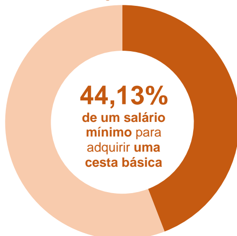
Gráfico 3 Participação do custo da Cesta Básica no salário mínimo (1) – jul. 2022