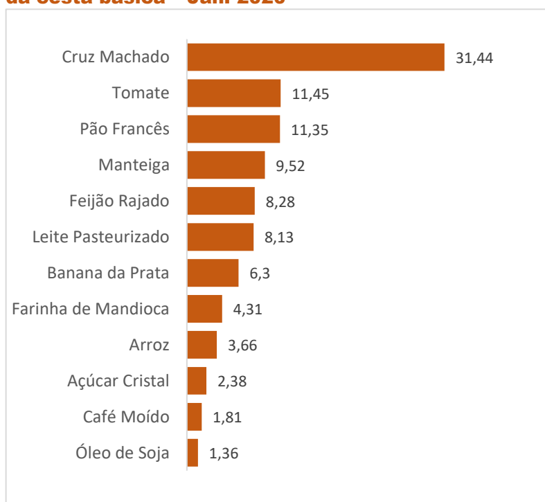
Gráfico 2 Participação dos produtos no custo total da cesta básica – Jan. 2020

Em janeiro de 2020, em Salvador, o trio arroz, feijão e carne foram responsáveis por 43,38% do valor de uma cesta básica, e o quarteto café, leite, pão e manteiga 30,81%. Os três produtos com maior participação no valor da Cesta Básica foram Carne Bovina (31,44%), Tomate (11,45%) e Pão francês (11,35%), e os itens com menor participação em valores monetários foram Açúcar cristal (2,38%), Café moído (1,81%) e Óleo de soja (1,36%).