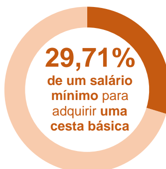
Gráfico 3 Participação do custo da Cesta Básica no salário mínimo (1) – Jan. 2020

Em janeiro de 2020, o tempo de trabalho gasto para se obter uma cesta básica em Salvador, por um trabalhador que recebe um salário mínimo por mês, foi de 65 horas e 22 minutos, ou seja, um comprometimento de 29,71% da sua renda. Nesta análise, considerou-se um salário mínimo líquido no valor de R$ 955,88, descontando-se 8,00% de contribuição previdenciária do salário bruto de R$ 1.039,00.