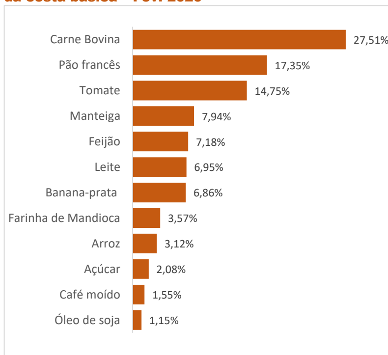
Gráfico 2 Participação dos produtos no custo total da cesta básica – Fev. 2020

Em fevereiro de 2020, em Salvador, o trio arroz, feijão e carne foram responsáveis por 37,81% do valor de uma cesta básica, e o quarteto café, leite, pão e manteiga 33,79%. Os três produtos com maior participação no valor da Cesta Básica foram Carne Bovina (27,51%), Pão francês (17,35%) e Tomate (14,75%), e os itens com menor participação em valores monetários foram Óleo de soja (1,18%), Café moído (1,55%) e Açúcar cristal (2,12%).