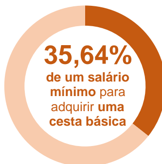
Gráfico 3 Participação do custo da Cesta Básica no salário mínimo (1) – Fev. 2020

Em fevereiro de 2020, o tempo de trabalho gasto para se obter uma cesta básica em Salvador, por um trabalhador que recebe um salário mínimo por mês, foi de 78 horas e 25 minutos, ou seja, um comprometimento de 35,64% da sua renda. Nesta análise, considerou-se um salário mínimo líquido no valor de R$ 961,40, descontando-se 8,00% de contribuição previdenciária do salário bruto de R$ 1.045,00.