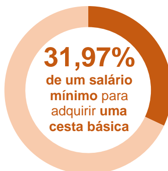
Gráfico 3 Participação do custo da Cesta Básica no salário mínimo (1) – Abr. 2019

Em abril de 2019, o tempo de trabalho gasto para se obter uma cesta básica em Salvador, por um trabalhador que recebe um salário mínimo por mês, foi de 70 horas e 20 minutos, ou seja, um comprometimento de 31,97% da sua renda. Nesta análise, considerou-se um salário mínimo líquido no valor de R$ 918,16, descontando-se 8,00% de contribuição previdenciária do salário bruto de R$ 998,00.