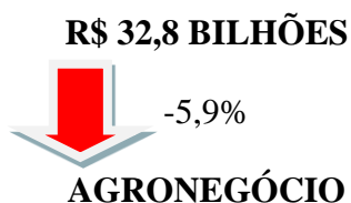
Figura 1 - PIB do agronegócio 2º tri. 2023