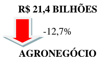
Figura 1 - PIB do agronegócio 1º tri. 2023